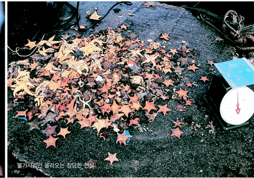
불가사리만 올라오는 참담한 현실

24일간 진행되는 이번 전시는 1부 박승근 기증사진전 『도시어부가 都市漁父歌』 (기획전시실)와 2부 「포해 捕海 - 바다에 사로잡히다」, 「푸른 군인, 해군」展(해양갤러리)으로 구성되었다.