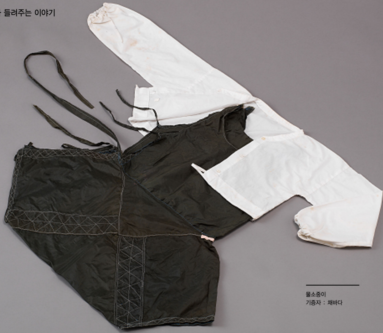
물소중이 기증자 : 채바다