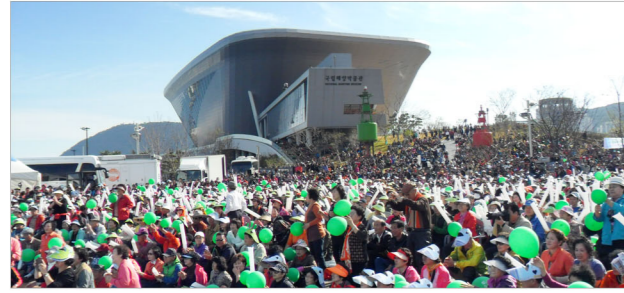
KBS2 전국노래자랑 <영도구편> 방영 2013.3.3

지난 10월, 국립해양박물관 일원에서 개최되었던 'KBS 전국노래자랑 <영도구편>'이 인기리에 방영되었습니다. 각종 촬영명소로 급부상한 국립해양박물관, 앞으로도 다양한 분야의 촬영유치를 통해 해양한국의 랜드마크가 되도록 노력하겠습니다.