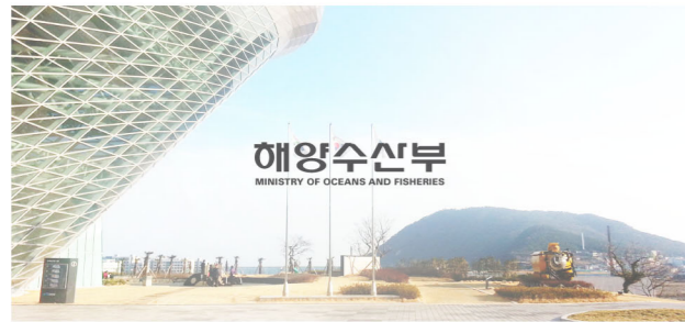
국토해양부에서 해양수산부로 소속변경 2013.3.25

국립해양박물관을 찾는 관람객들의 교통편의를 위해 박물관을 경유하는 66번 시내버스를 주말에 추가 운행합니다. 평일 운행차량보다 2배 더 늘려 10분 간격으로 운행되어 박물관을 찾아오는 길이 한결 편리해 질 것으로 예상됩니다.