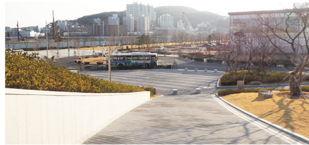
국립해양박물관 경유 시내버스 주말 추가운행 2013.3.16

지난 10월, 국립해양박물관 일원에서 개최되었던 'KBS 전국노래자랑 <영도구편>'이 인기리에 방영되었습니다. 각종 촬영명소로 급부상한 국립해양박물관, 앞으로도 다양한 분야의 촬영유치를 통해 해양한국의 랜드마크가 되도록 노력하겠습니다.