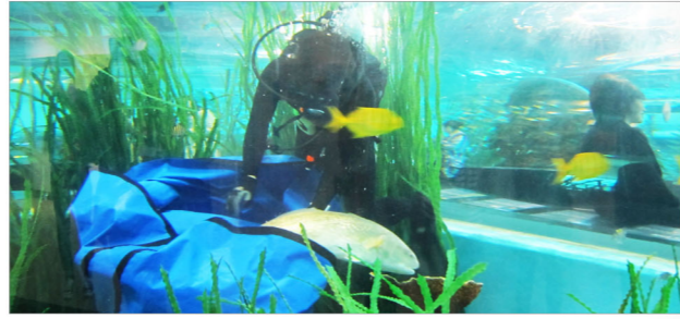
국립해양박물관 새 식구, 14년 키운 홍민어 2013.3.7

국립해양박물관이 5년 만에 부활한 해양수산부에 새로운 동지를 댔습니다. 부활하는 해양수산부는 해양 정책, 해운·물류, 수산, 항만, 해양환경, 해양 R&D(연구개발), 해안 심판 등의 업무를 맡게 됩니다. 해양과 문화, 해양활동의 역사와 비전을 제시하는 데에 국립해양박물관이 그 역할을 다하겠습니다.