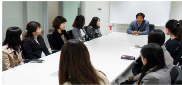
2013년 국립해양박물관 자원봉사자 출범 2013.3.19

부산시 기장 칠암군 소재의 횡집에서 애지중지 키운 홍민어 2마리를 국립해양박물관에 기증해주셨습니다. 민어가 더 큰 수조에서 자유롭게 살 수 있게 하기 위해 기증을 결심하셨다고 합니다. 1m의 큰 덩치를 자랑하는 홍민어를 국립해양박물관 수족관에서 찾아보세요.