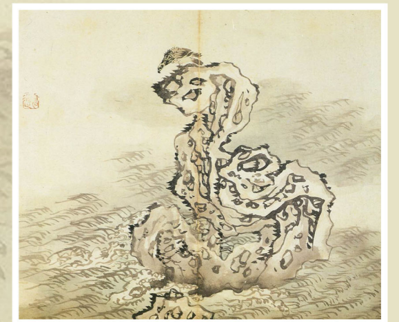
해암호취, 김홍도, 1795년, 23.2x27.7cm, 『을묘년화첩』, 개인 소장