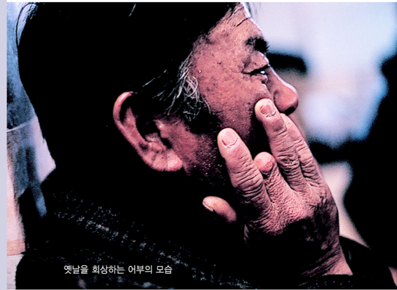
옛날을 회상하는 어부의 모습