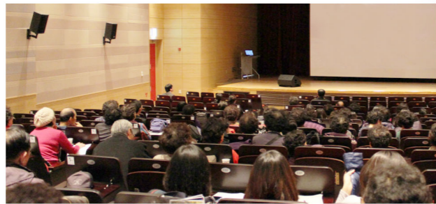
가족영화 무료상영 '해양가족극장' 2013년 4월

전시장·어린이박물관 및 해양도서관 관리지원, 교육프로그램 운영지원을 도와주실 국립해양박물관 자원봉사자 15명의 출범식이 있었습니다. 오리엔테이션을 마친 자원봉사자 분들은 3월 26일부터 1년간 국립해양박물관에서 봉사활동을 하게 됩니다.